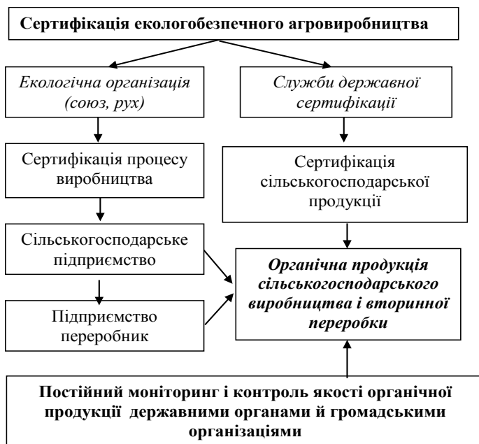
Рис. 3. Система сертифікації й контролю процесу виробництва органічної продукції й кінцевого продукту від її переробки

7) транспортування, зберігання та реалізації екологічно безпечної продукції (сировини) [7, с. 119].