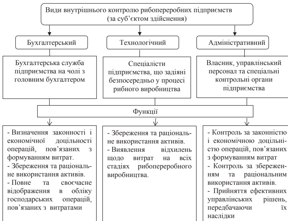
Рис. 2. Види внутрішнього контролю витрат та їхніх функції на рибопереробних підприємствах

Також науковці виділяють три основних етапи організації системи внутрішнього контролю витрат виробництва: попередній, поточний та наступний контроль. Варто зазначити, що діюча практика організації внутрішнього контролю витрат на досліджуваних рибопереробних підприємствах показує наявність тільки поточного виду контролю (у частині виявлення відхилень фактичних витрат рибного виробництва від запланованих