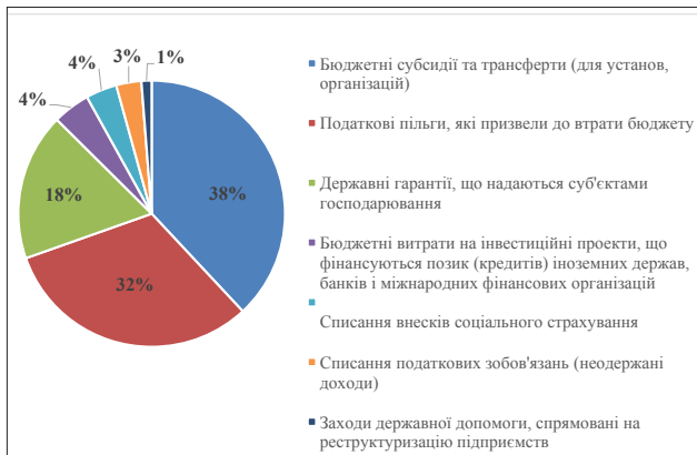
Рис. 2. Структура системи державної допомоги в Україні в 2014 р. (% від загальної суми)

Із метою визначення найбільш вживаних методів державної допомоги в Україні в 2014 р. розглянемо на рис. 2 структуру системи державної допомоги.