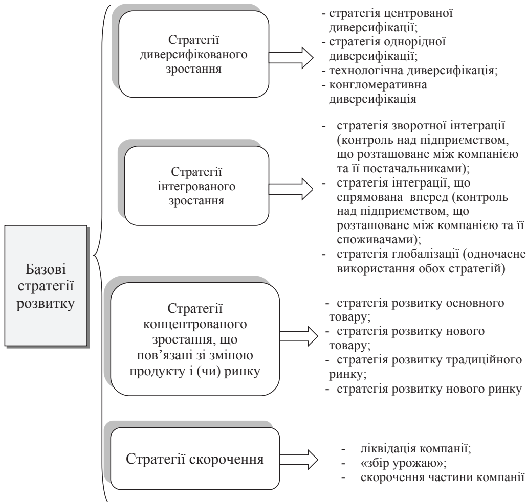
Рис. 1. Види базових стратегій розвитку [9–16]

Друга група еталонних стратегій – стратегії інтегрованого зростання – пов'язані з розширенням підприємства через додавання нових структур. Підприємству доцільно використовувати цю групу стратегій, коли воно перебуває в сильному бізнесі, але не може здійснювати стратегії концентрованого зростання. Водночас інтегроване зростання не суперечить довгостроковим цілям