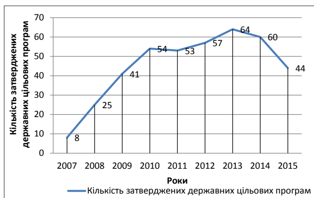
Рис. 1. Динаміка кількості затверджених державних цільових програм протягом 2007–2015 рр.

Важливу роль у процесі раціонального використання природно-ресурсного потенціалу країни відіграють загальнодержавні програми, які сприяють науково обґрунтованому застосуванню програмно-цільового методу стратегічного планування шляхом здійснення макроекономічної політики на пріоритетних напрямках державного соціального, економічного та екологічного розвитку. Водночас слід зазначити, що кількість затверджених державних цільових програм різного спрямування у 2015 р. становила 44 програми (рис. 1), що в 5,5 рази більше, ніж у 2007 р. Незважаючи на спадні тенденції в 2010–2011 рр. та 2013–2015 рр., які пов'язані з економіко-політичною нестабільністю та військовими діями, вже в 2016 р., за інформацією Кабінету Міністрів України, кількість прийнятих до виконання державних програм переважала 50 найменувань. Незважаючи на таку кількість програм, як свідчить практика, вони ще не стали ефективним інструментом управління національною економікою, тому, на нашу думку, необхідно оптимізувати їх кількість шляхом виокремлення першочергових (дуже важливих і термінових до виконання програм), стратегічних (дуже важливих, але не термінових), потенційних (не дуже важливих і не термінових) та другорядних програм щодо управління розвитком держави. Такий поділ дасть змогу конкретизувати національну стратегію в розрізі програм, підпрограм і видів діяльності та подальшого детальнішого їх групування за спрямуванням.