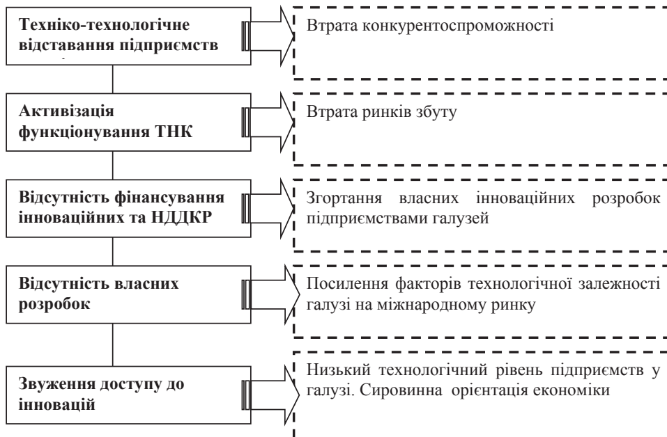
Рис. 2. Фактори та наслідки дії загроз інноваційній безпеці галузі