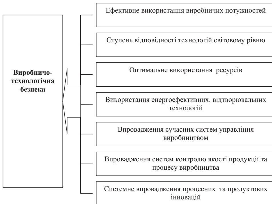
Рис. 1. Фактори впливу на рівень виробничо-технологічної безпеки