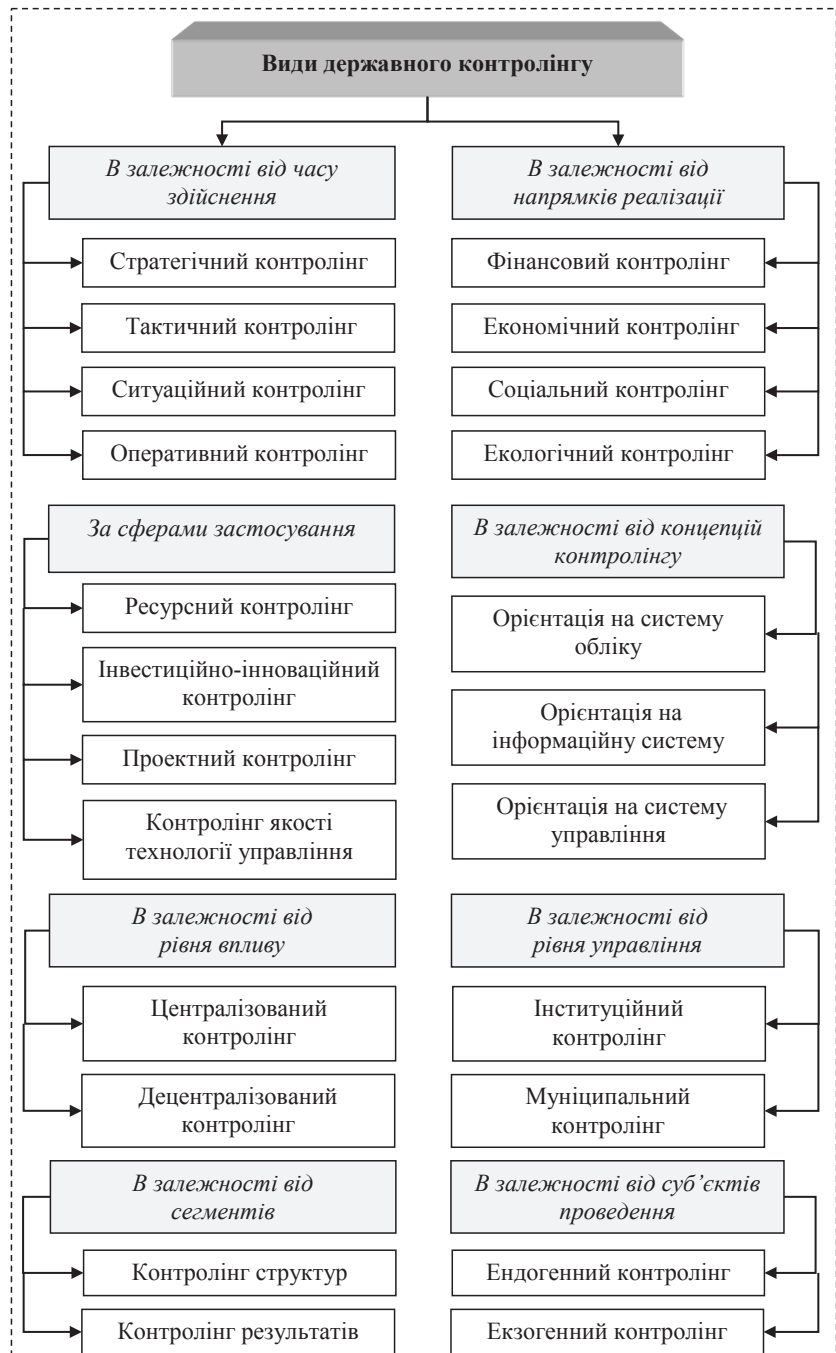
Рис. 1. Класифікація державного контролінгу

Підвищення ступеня раціональності системи державного регулювання, враховуючи високу інформативність щодо стану об'єктів, залежить від правильного поєднання та своєчасності використання методів при вирішенні управлінських питань як стратегічного або тактичного, так й оперативного контролінгу. Порівняльна характеристика складових даних видів державного контролінгу представлено на рис. 2.