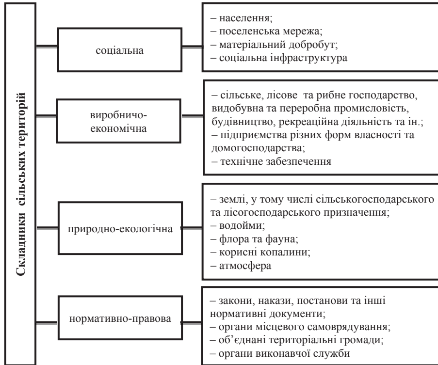
Рис. 1. Складники сільських територій