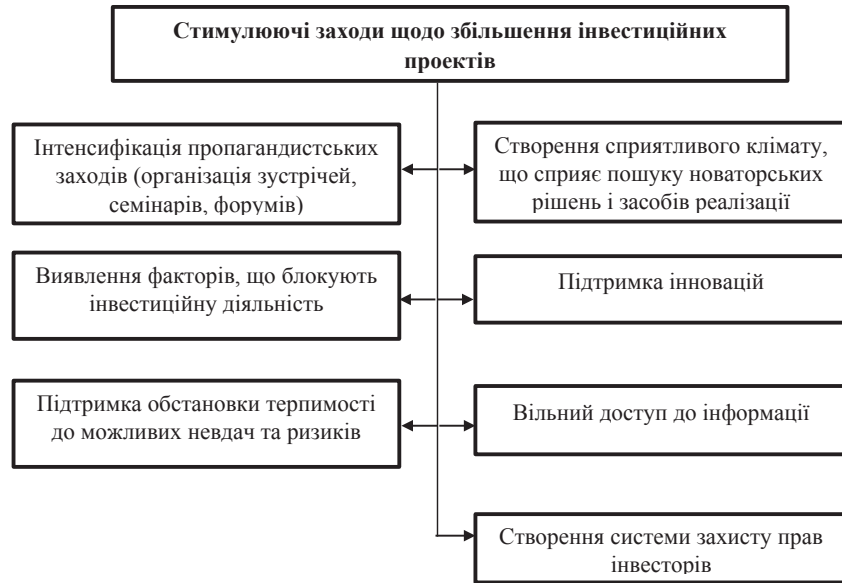
Рис. 1. Основні стимулюючі заходи щодо збільшення ефективних інвестиційних проектів