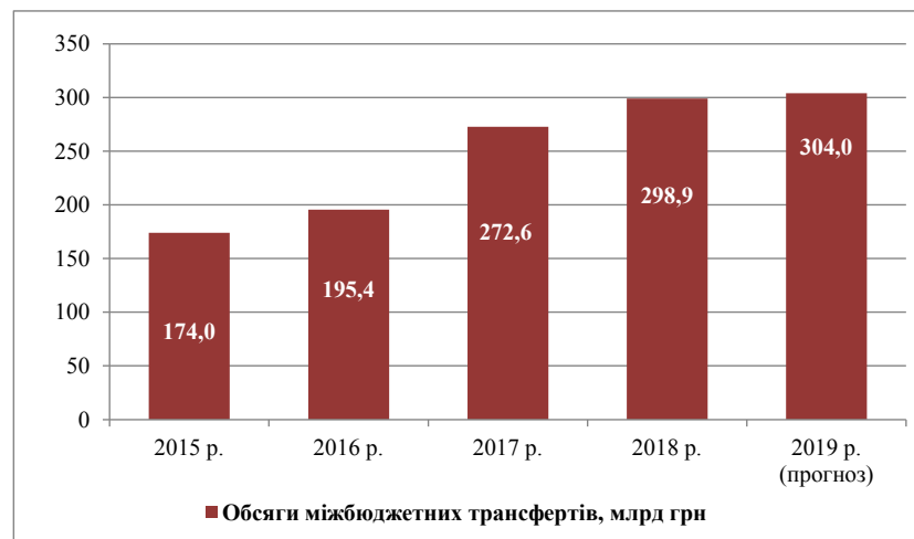
Рис. 4. Обсяги наданих місцевим бюджетам міжбюджетних трансфертів, млрд грн