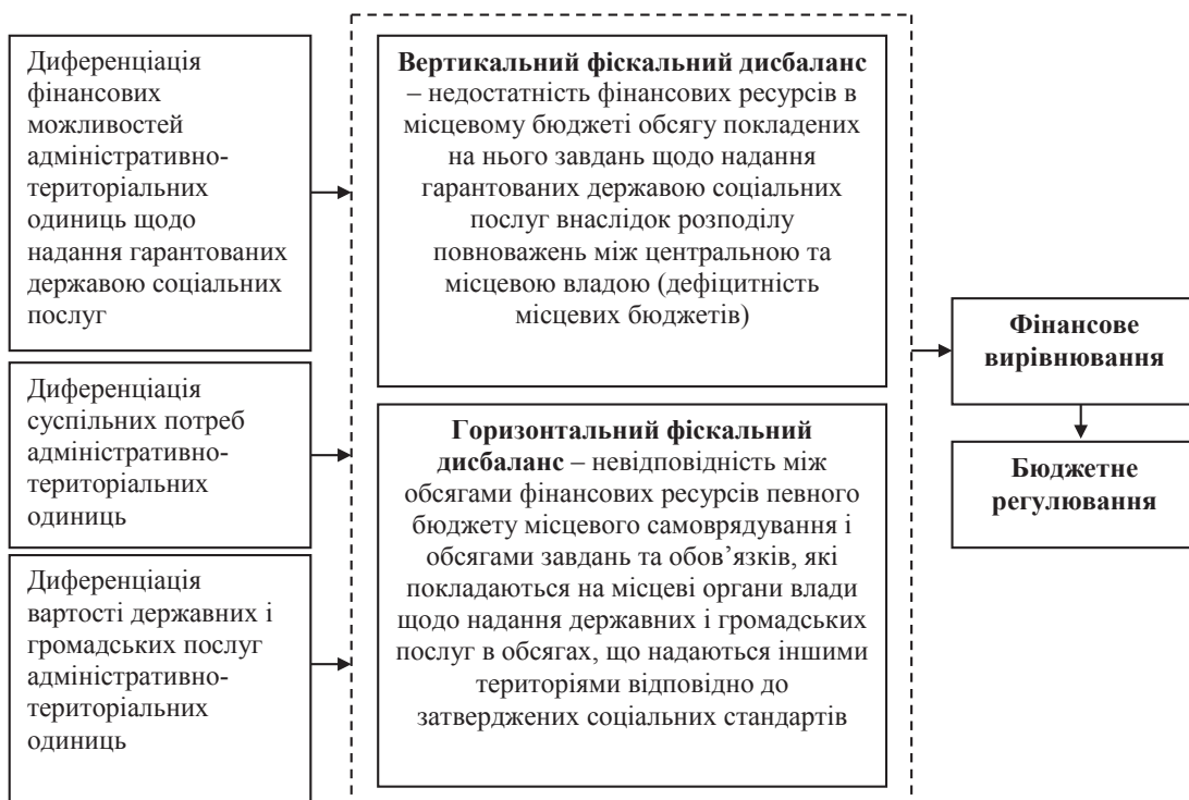
Рис. 1. Причини застосування фінансового вирівнювання в межах бюджетного регулювання

Сам термін «фінансове вирівнювання» був запозичений із зарубіжної практики регулювання бюджетних відносин, але в різних країнах методики його здійснення різняться, спираючись на