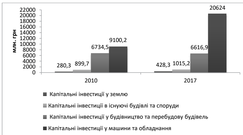
Рис. 4. Структура капітальних інвестицій торговельних підприємств у матеріальні активи в 2010 та 2017 рр.

ності інвестицій. Проведений аналіз інвестиційної діяльності торговельних підприємств України дав змогу визначити її особливості та тенденції, що вказують на привабливість торгівлі з погляду інвесторів, що вкладають в обладнання, будівництво та перебудову будівель.