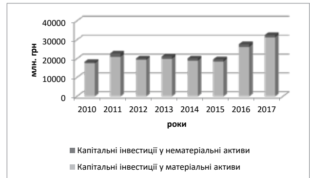
Рис. 3. Динаміка змін обсязі капітальних інвестицій у матеріальні та нематеріальні активи торговельних підприємств за 2010–2017 рр.