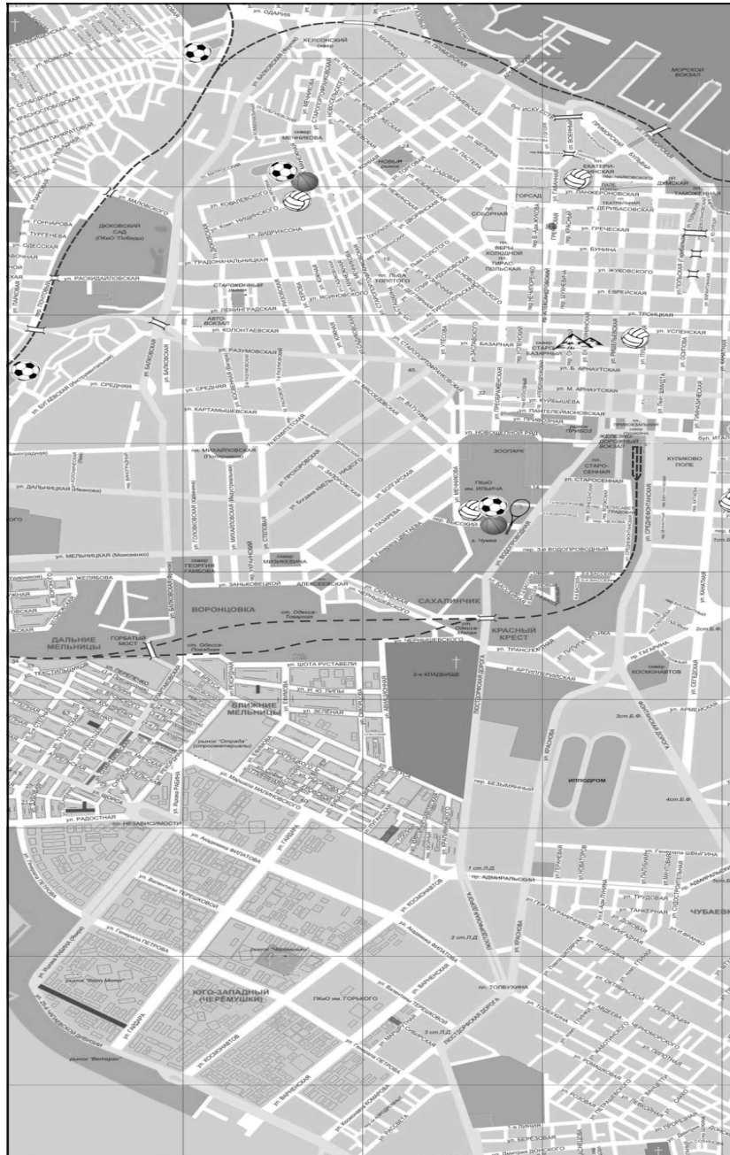
Рис. 2. Объекты спортивного туризма исторической части г. Одесса