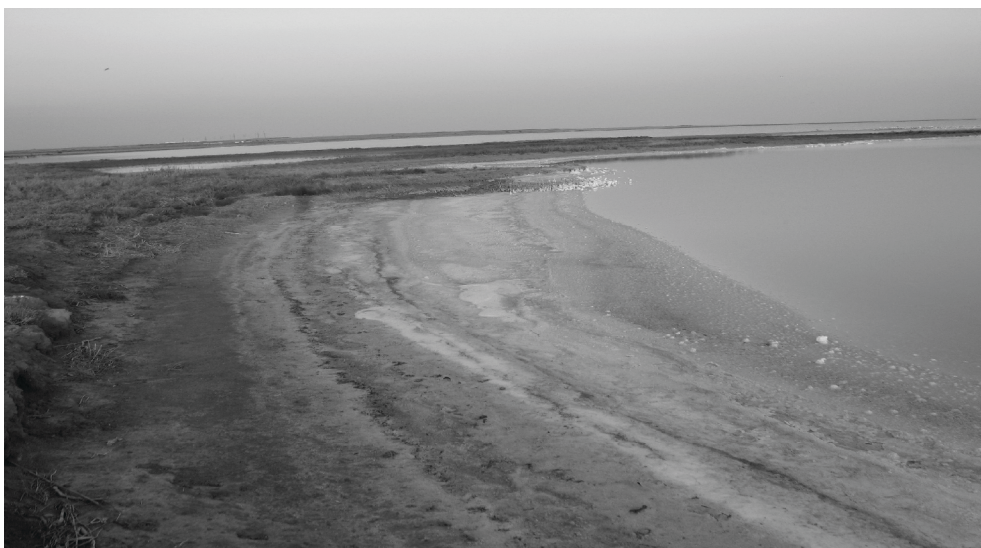
Рис. 4. Типовий вітроприсушний берег Західного Сивашу

Рослинний покрив берегової зони Західного Сиваша в значній мірі трансформований (рис. 4).