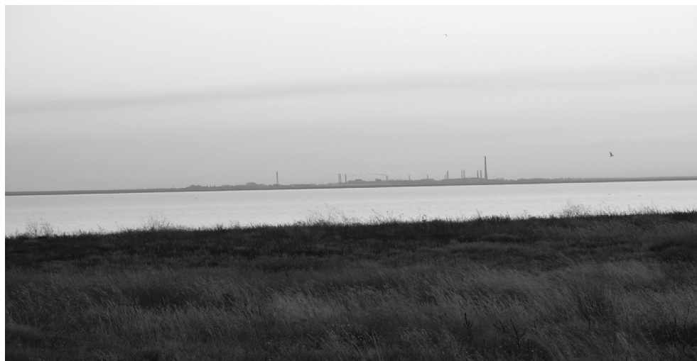
Рис. 5. Західний Сиваш з якого видобувають сировину для КДВО «Титан» (на задньому плані)

Ділянки берегової зони Центрального Сивашу в межах мису Кутара зазнають значного впливу нагонів, що пов'язано насамперед зі згоном води з акваторії в цю частину водойми при загальному підвищенні рівня під час вітрових нагонів. Тут поширені активні кліфи висотою 4 – 4,5 м. У зв'язку з тим, що рослинність на даних ділянках берегу починається на верхній кромці кліфу, висота якого перевищує максимальні нагонні рівні, вона не відчуває впливу нагонів і представлена такими видами як Festuca beckeri , Festuca valesiaca , Salsoa tragus , Salsoa soda , Artemisia santonica , Poa bulbosa , Atriplex aucheri , Agropyron pectiniforme , Koeleria cristata тощо.