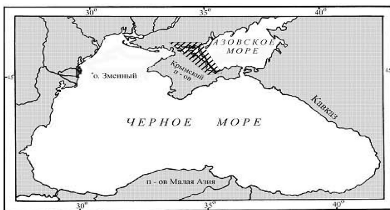
Рис. 1. Місце району дослідження (позначене заштрихованим чотирикутником) між Арабатською Стрелкою і Перекопським перешийком

Дослідження особливостей рослинності берегової зони затоки Сиваш (рис. 1) проведені 2005-2006 роках під час експедиційних робіт на 12 ділянках в районі Західного, Центрального, Східного та Південного Сиваша із застосуванням маршрутно-експедиційного, порівняльно-географічного, аналітичного, картографічного, морфологічного, систематизаційного методів дослідження. Для отримання характерних особливостей рослинності берегової зони на типових ділянках берегу Західного, Центрального, Східного та Південного Сиваша були закладені геоботанічні пересіки (рис. 2). На кривій кожного пересіку до уваги бралися такі показники: видове різноманіття, проективне вкриття, відносна висота, особливості морфології. Профіль поверхні був отриманий під час нівелювання, а зразки рослинності бралися в межах базових ділянок. До базових ділянок ми відносили будь-які добре виражені зміни в морфології поверхні берегової зони та видового різноманіття рослинних угруповань. Загальна довжина кожного з профілів, в залежності від геоморфологічних умов та поширення рослинних організмів, знаходилася в межах від 70 до 300 м (рис. 3).