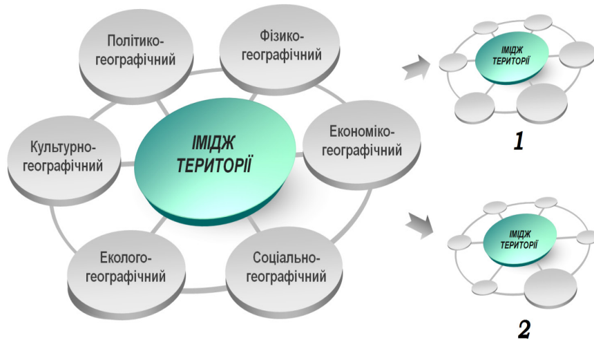
Рис.2. Функціонально-структурні складові іміджу території

особливостей розвитку сервісного сектору, стан здоров'я населення і криміногенність середовища;