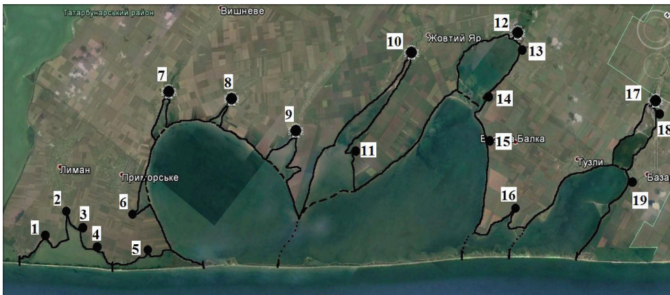
Рис. 3. Місця впадіння водотоків у водойми національного природного парку «Тузловські лимани» (позначення, як на рис. 1; номери відповідають наведеному у табл. 3)

Крім понизь природних водотоків, в межах НПП знаходяться чотири штучні ділянки водотоків – каналізовані та випрямлені частини русел річок Хаджидер, Алкалія, Сарияри, Мартаза.