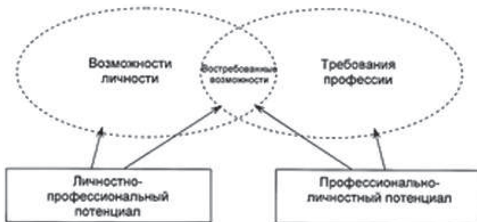
Рис. 2. Строеие личностно-профессионального потенциала (по В. Н. Маркову)

Личностно-профессиональный потенциал рассматривается в соотношении возможностей личности и требований профессии (рис. 2).