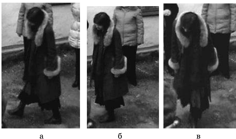
Фото 1. Життєвий шлях І