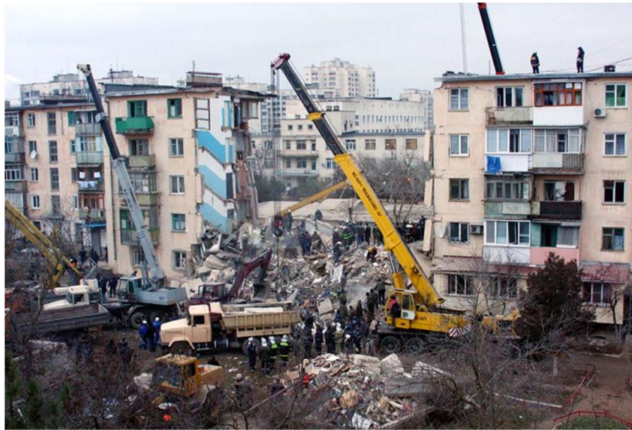
Рис. 2. Використання кранів та іншої техніки у Євпаторії

Підвищити продуктивність використання кранів та безпеку розбирання завалів можливо за допомогою установки на стропах захватів (рис. 3). Це у багатьох випадках дозволило не заводити стропи під уламки, а схоплювати їх за зовнішні поверхні [1; 5]. До недоліків цього обладнання слід віднести те, що захвати на стропах недоцільно використовувати при схоплюванні невеликих за розмірами уламків (менше 0,1 \text{ м}^3 ), а це потребує використання додаткової навантажувальної техніки.