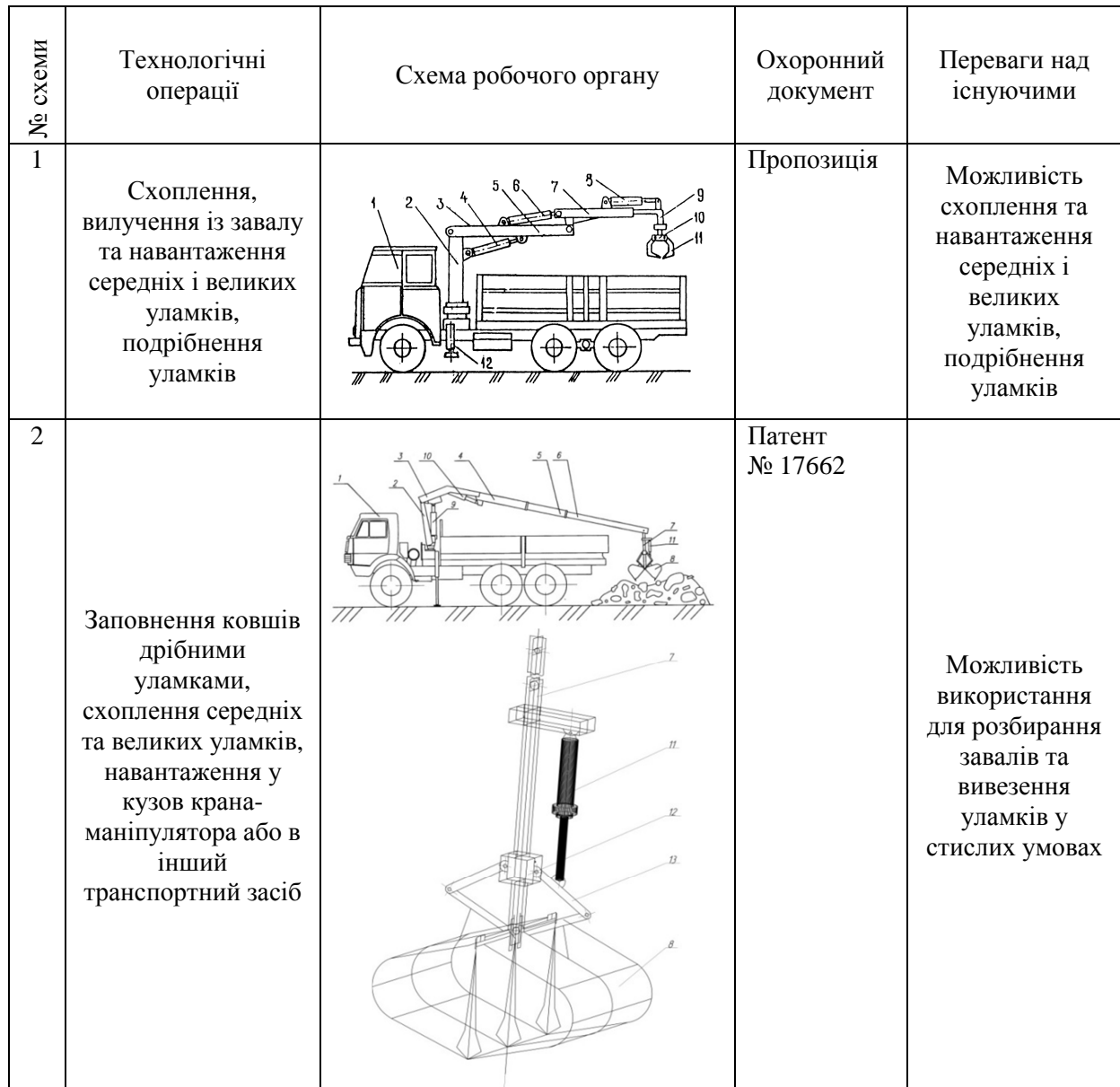
Т а б л и ц я Пропозиції по удосконаленню робочих органів кранів для розбирання завалів

Робоче обладнання також дозволяє (рис. 5) виконувати розбирання пошкоджених споруд та завантажувати уламками інші транспортні засоби.