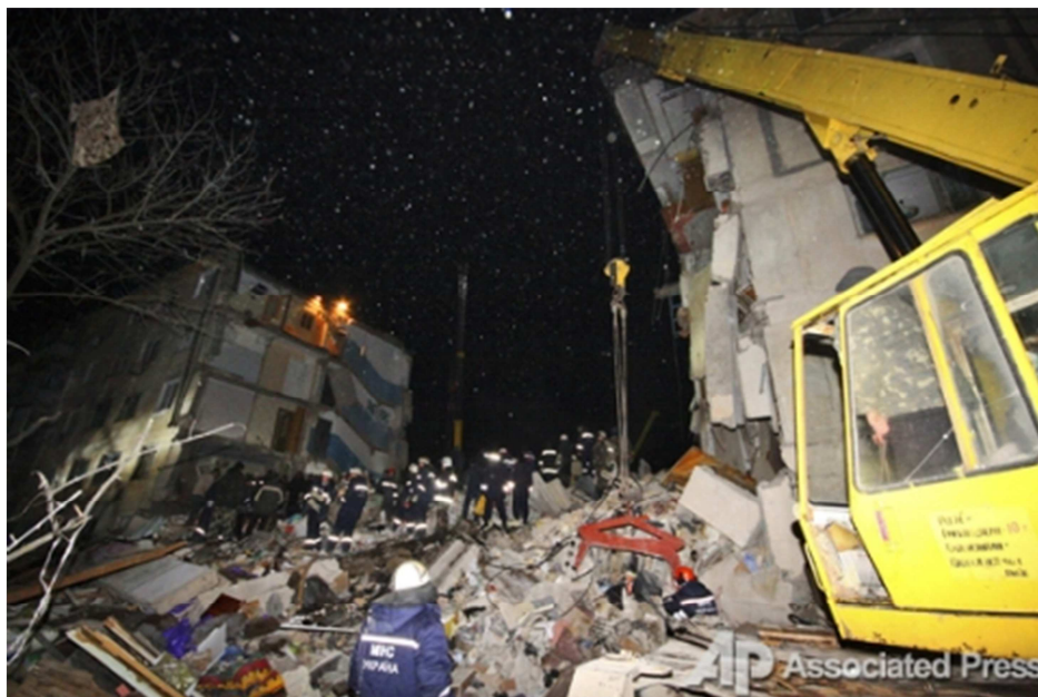
Рис. 3. Розбирання завалу з використанням захвату на крані

Підвищити продуктивність використання кранів та безпеку розбирання завалів можливо за допомогою установки на стропах захватів (рис. 3). Це у багатьох випадках дозволило не заводити стропи під уламки, а схоплювати їх за зовнішні поверхні [1; 5]. До недоліків цього обладнання слід віднести те, що захвати на стропах недоцільно використовувати при схоплюванні невеликих за розмірами уламків (менше 0,1 \text{ м}^3 ), а це потребує використання додаткової навантажувальної техніки.