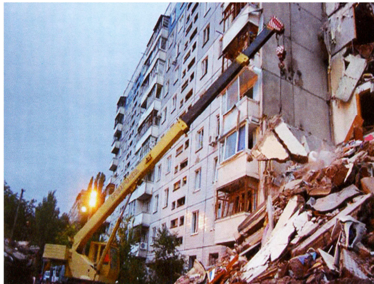
Рис. 1. Розбирання завалу телескопічним краном у Дніпропетровську

Аналіз публікацій. До стихійних лих відносять землетруси, урагани, зсуви ґрунту та повені. Проявами техногенних катастроф та аварій є вибухи газу, пожежі, руйнування мереж водопостачання та каналізації [1 – 5; 10]. Аналіз аварійно-рятувальних робіт у Вірменії (1989 р.), Дніпропетровську (2007 р.), Євпаторії (2008 р.) показав, що розбирання завалів було пов'язане із руйнуванням ушкоджених конструкцій та великогабаритних уламків, їх підйомом, навантаженням ывивезенням [1; 3; 5].