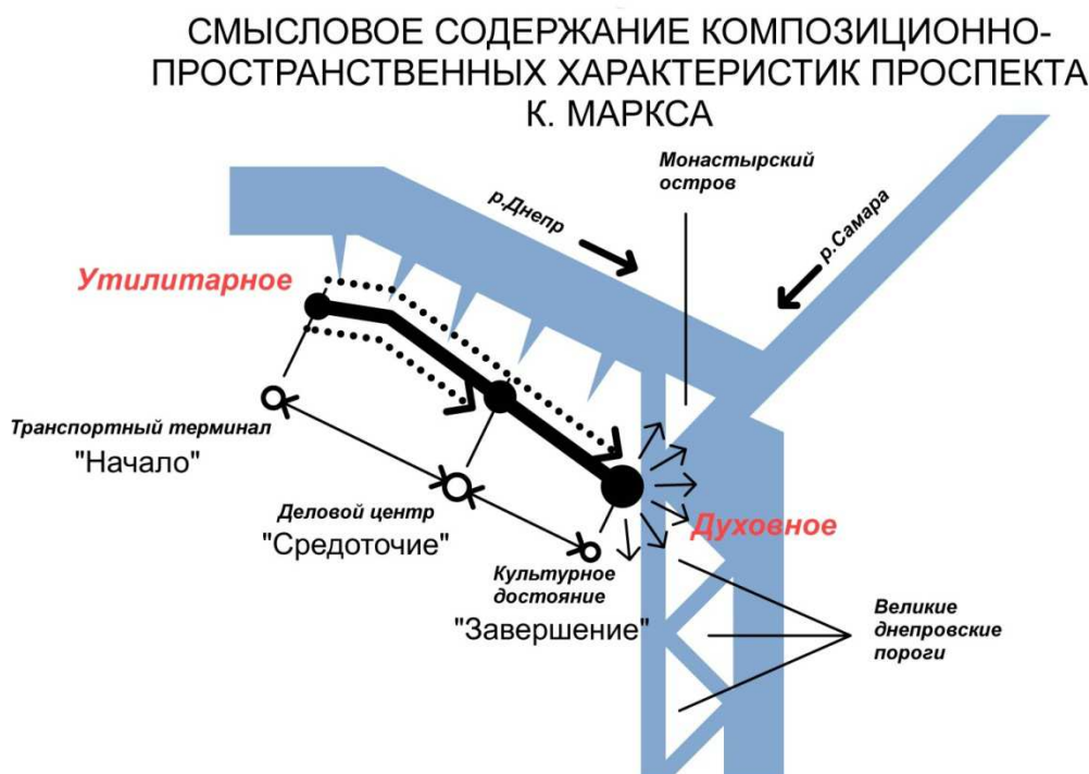
Рис. 3. Смысловое содержание композиционно-пространственных характеристик проспекта К. Маркса

Таким образом, Проспект получил естественное, функционально глубоко обоснованное продолжение в юго-западном направлении. Был закреплён и ярко подчеркнут смысловой статус всего юго-западного участка Проспекта и прилегающей к нему территории – духовно-просветительский (рис. 3).