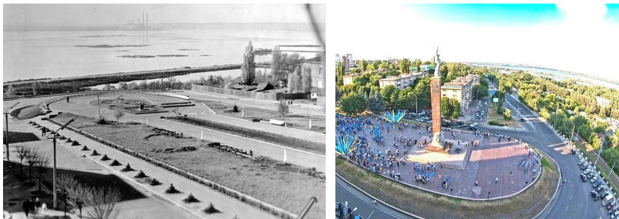
Рис. 1. Площадка застройки Мемориала «Вечная Слава»: начало строительства и современное положение

Строительство Монумена «Вечная Слава» стало для города Днепропетровска знаменательным событием (рис. 1). Сразу несколько важнейших смыслов обрели материальную форму. В первую очередь это, конечно, знак Великой победы, но одновременно это и логичное завершение главного проспекта города. Здесь, на видовой площадке, в сознании зрителя объединяются в единое целое город и пространство долины Великой реки.