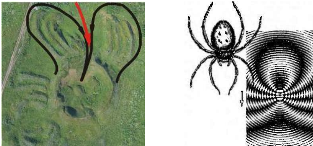
Рис. 5. Зображення спайдер-ефекту

Ми можемо зробити певний висновок на шляху функціонального визначення: майдан – це випромінювач енергії. Іншими словами: чим би не була досліджувана споруда, їй притаманна обов'язкова властивість випромінювання енергії в навколишній простір. І як би не випромінювалась ця енергія – розсіяним або сконцентрованим потоком, в одному напрямку або в декількох, хоч невідомі поки ні вид цієї енергії, ні мета, ні завдання цього випромінювання, але вже ясно: майдан – це випромінювач.