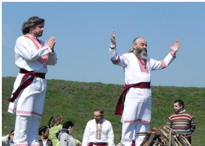
Рис. 3. Сучасне свято Ярила на Мавринському майдані

кожного року прихильники там проводять День Ярила. У сонця, місяця, зірок просили своєчасних дощів, тепла, врожаю, приплоду, здоров'я, достатку. В ім'я всього цього приносили в жертву тварин. Тут здійснювали ритуал проведів у Вічність через вогнище. На цьому місці мислили про вічність і про безсмертя душі... А тепер на майдан приїжджають громади з різних міст та приєднуються до свята, тому свята на Мавринському майдані поступово перетворюються на ведичні фестивалі в українському народному стилі [9, с. 12].