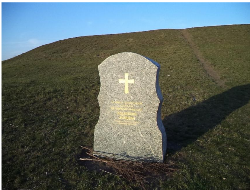
Рис. 1. Пам'ятник славним запорізьким козакам від вдячних нащадків на Мавринському майдані

Розглянемо версії походження майдану. Версія перша. Майдан – козацька оборонна споруда.