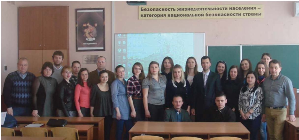
Студентська конференція «Безпека життєдіяльності в XXI столітті», жовтень 2016 р., ПДАБА