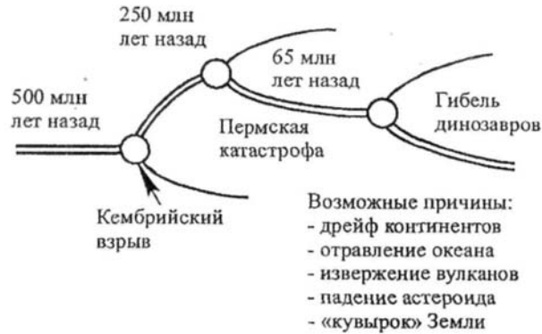
Рис. 3. Скачки в эволюции жизни на Земле соответствуют точкам бифуркации на общей линии самоорганизации биосистем. Кембрийский взрыв – лавинообразное создание большого разнообразия в живых организмах (возникновение животных, птиц, рыб и т. д.), Пермская катастрофа – массовая гибель живых организмов на земле и в океане. Гибель динозавров – спонтанное вымирание животных на суше

ject) был расшифрован геном человека. Этот успех молекулярной биологии открывает принципиально новые пути для развития биотехнологии, генной медицины и фармакогенетики.