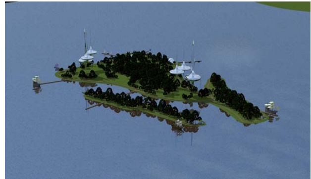
Рис. 3. Пример архитектурно-ландшафтной организации острова им. Ленина, основанной на использовании объектов «нулевой плавучести» в воздушном бассейне, в том числе - крондендроорбиталей - не воспринимаемых с внешних пространств, не передающих нагрузки на деревья, не создающих экологических проблем

человеческого организма, не имеют себе конкурентов в мире. Крапивный кремний упоминается едва ли не во всех древних мифах, повествующих о лечебных рубахах, дающих к тому же большую силу воинам. Что, между прочим, и использовалось в армиях Западной Европы до 50-х годов XX века, и снова возвращается на «круги своя».