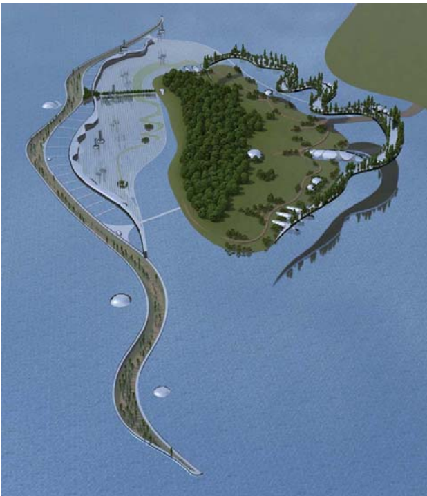
Рис. 2. Остров Кодачок в окружении периметральных акваферм свайно-наплавного и погружного типа, а также лентовидных ферм с «нулевой плавучестью» в атмосфере

приречных трав. Отличительной особенностью их производства является то, что оно не требует больших строений, превращающих остров в урбанизированную зону, вытеснившую естественную природу. Они могут размещаться в «растворившихся» в природе прозрачных фермах. Фермах, «невидимых» со стороны, не занимающих много места, дающих продукцию круглый год и не требующих сложных и дорогостоящих технологий. Их инвестиционная привлекательность высока. Проблема лишь в том, что нет понимания, насколько выгодно заниматься этим направлением бизнеса (рис. 2, рис. 3).