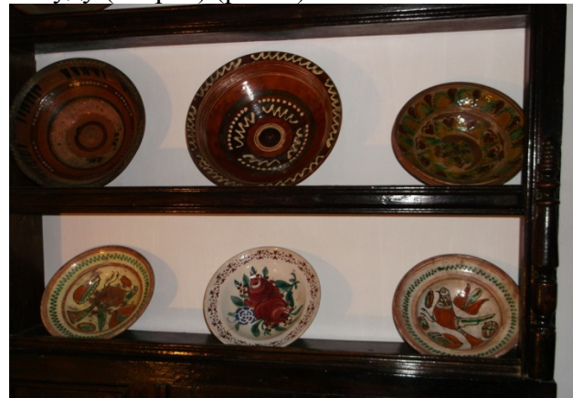
Рис. 3. Мисник-полиця

В українській хаті крім печі (рис. 1), що, власне, завжди була осередком родинного побуту, в якій і готували їжу у глиняному посуді, на побілених стінах хати кольоровою плямою виділявся мисник із гончарним посудом, оздобленим вишитими рушником чи рушником для витирання посуду (стирач) (рис. 2).