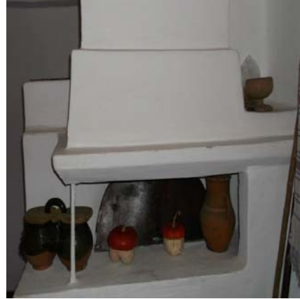
Рис. 1. Вариста піч, у якій готували в глиняному посуді

пошкоджена. Горщик із надщербленими вінцями, без вінець чи з тріщиною називали гирявим (гирун, горюнчик) [8].