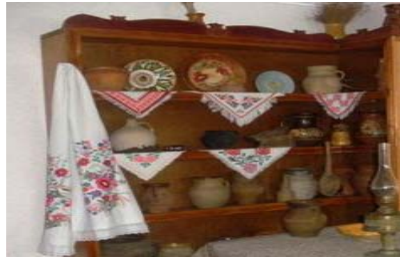
Рис. 2. Мисник із посудом та рушником для його витирання

В українській хаті крім печі (рис. 1), що, власне, завжди була осередком родинного побуту, в якій і готували їжу у глиняному посуді, на побілених стінах хати кольоровою плямою виділявся мисник із гончарним посудом, оздобленим вишитими рушником чи рушником для витирання посуду (стирач) (рис. 2).