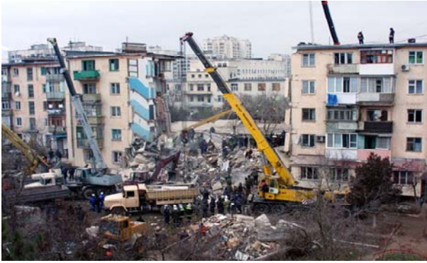
Рис. 3. Схема розстановки та переміщення машин у процесі розбирання руйнувань (Євпаторія, 2008 р.) традиційною будівельною технікою

В окремих випадках розбирання уламків виконується грейферним обладнанням або гідравлічними ножицями на базі кранів та екскаваторів. Їх використовують без аналізу характеру руйнувань об'єктів та розмірів уламків. Відсутні дослідження з визначення кількості та структури (типи машин) матеріально-технічного забезпечення