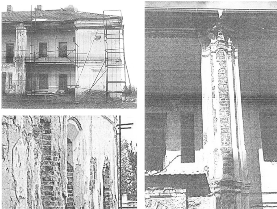
Рис. 4. Будинок Митрополита в с. Жидичин, Волинська обл. Фото 2008 р.

Етапи реставрації екстер'єру та інтер'єру монастирських приміщень тривають з 2008 року. Цей процес, на жаль, виявився затяжним, у першу чергу через брак коштів – усе фінансування залежить тільки від пожертв прихожан монастиря, його благодійників та жертводавців. Тому ремонтно-реставраційні роботи проводяться поступово, з урахуванням найважливіших проблем.