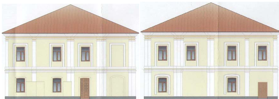
Західний фасад. Східний фасад.