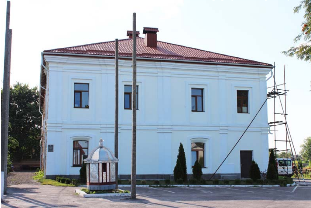
Сучасний стан монастиря.

рівна та гладенька, витягування карнизів, тяг, лиштв, наличників, обробка кутів, тяг, тинькування стовпів та напівкруглих елементів, фарбування фасаду.