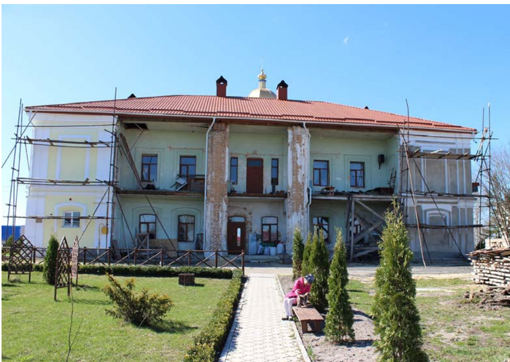
Сучасний стан монастиря.

Висновок. Під час написання статті автор виявив, що фасад Будинку митрополита Жидичинського чоловічого монастиря святителя Миколая