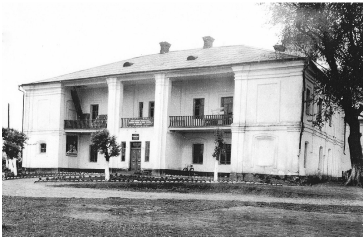
Рис.1. 1972 р.

пам'яток архітектури державного значення і через аварійний стан їх розібрали у 1990-х роках.