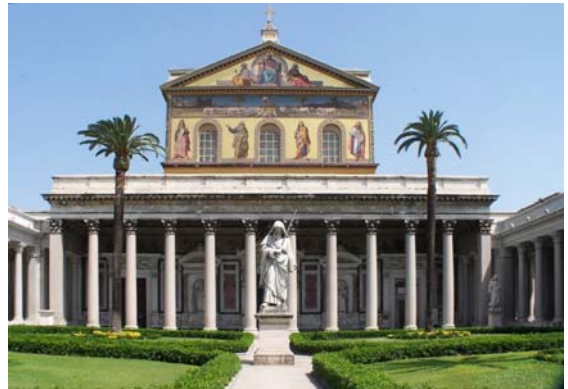
Рис. 1. Собор Св. Павла в Римі «поза муром»

Нове місце побудови міста Катеринослав на цей раз було обрано особисто Потьомкіним та провідними тогочасними архітекторами Росії. Планувалося, що кращим місцем буде великий пагорб на зломі ріки (сучасний Нагірний масив). Із документів, що збереглися до наших часів, видно, з яким розмахом планувалося будівництво. За проектом Потьомкіна головна і краща частина міста була запропонована на Соборній горі. Тоді це місце було абсолютно голим, покрите травою, бур'яном та чагарником. Найближчі будівлі – глиняні хати слободи Половиця, під горою біля Дніпра, в районі нинішніх вулиць Колодязна, Ливарна, Кам'яниста, Барикадна. У той час там налічувалося близько 100 мазаних будівель. До найближчого адміністративного центру – Кременчука кінями треба було їхати принаймні кілька днів.