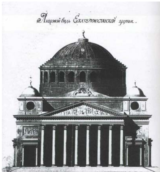
Рис.3. Початковий нереалізований проект Преображенського собору К. Геруа

Вдалий вибір нового майданчика під будівництво міста остаточно затвердив Потьомкін у своїх намірах. Ось що він пише Катерині II у своїх проектних міркуваннях щодо майбутнього міста: «Центр строительства на горе – Собор – внутри подражание собору Св. Павла в Риме ( Basilica di San Paolo fuori le Mura , див. рис. 1), а снаружи подражание собору Св. Петра в Риме ( Basilica di San Pietro , див. рис. 2), храм великолепный, посвященный Преображению Господнему, в знак того, что страна сия из стезей бесплодных преобразена в вертоград обильный и обиталище зверей – в благоприятное пристанище людей из всех