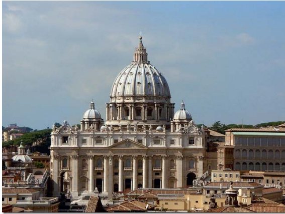
Рис. 2. Собор Св. Петра в Римі

життя півдня Росії. Катеринославу відводилася особлива роль, його передбачалося перетворити на «третю південну столицю Російської імперії».