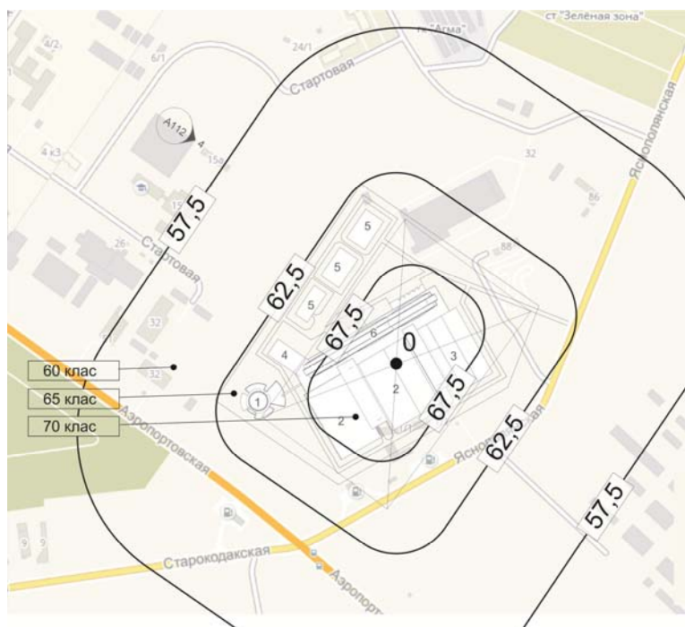
Рисунок 3. Карта шуму з урахуванням класу шумності для об'єктів, прилеглих до підприємства «Виробничий комплекс "Кропива"» / Noise map based on noise level for objects adjacent to the enterprise «Industrial complex "Kropyva"»