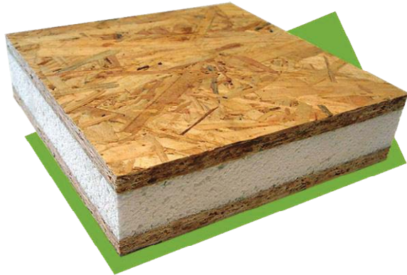
Рис. 1. Структурна ізоляційна панель (СПІ) / Fig. 1. Structural insulation panel (SIP)

В основі СПІ-технології лежить використання теплоізоляційних панелей – СПІ, які служать основними конструкційними елементами об'єкта будівництва (рис. 1).