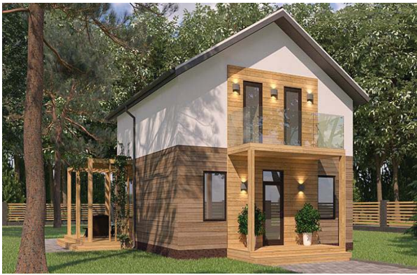
Рис. 2. Енергоефективний будинок із СІП-панелей / Fig. 2. Energy efficient home made of SIP panels

Розміри плити і маса. СІП структурна ізоляція – панель має максимальну висоту 3 500 мм. Ширина панелі – від 625 мм до 1 500 мм. Товщина – 60...220 мм [1].