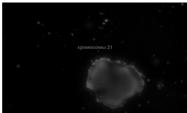
Рис. 1. Тетрасомия по хромосоме 21 (хромосомы 21-красный сигнал)

Результаты исследований и их обсуждение. Процедуру ПГД в программе ЭКО прошло 25 пар. Всего было исследовано 86 эмбрионов. Для проведения ПГД отбирались эмбрионы наиболее высокого качества. Хромосомные аномалии были обнаружены у 17 эмбрионов (19,76% всех исследованных эмбрионов). При этом 3 пациентов (12%) все проанализированные эмбрионы содержали хромосомные аномалии. У 19 эмбрионов (22,1%) ядра в blastомерах отсутствовали. 10 ядер (11,6% ядер) было разрушено при проведении ПГД. Реакция прошла в 91,9% случаев. Особенности анеуплоидий 17-ти аномальных эмбрионов представлены в таблице 1. Фотографии отдельных анеуплоидий представлены на рис. 1-3.