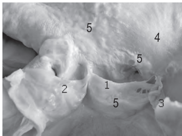
Рис. 1. Клапан аорты при его недостаточности вследствие атеросклероза. 1 – задняя полулунная створка, 2 – правая полулунная створка, 3 – левая полулунная створка, 4 – стенка аорты, 5 – атеросклеротические бляшки и кальцификаты.

При аортальной недостаточности вследствие атеросклероза мы наблюдали неравномерное склерозирование и наличие кальцификатов от начала створки до середины ее длины. Атеросклеротические бляшки имели светло-желтый цвет. Свободный край полулунных створок был значительно утолщен ( рис. 1 ). Толщина свободного края задней полулунной створки аортального клапана колебалась от 1,5 мм до 1,8 мм, правой от 1 мм до 1,3 мм и левой от 0,8 мм до 1, 2 мм. Полученные нами результаты совпадают с мнением Ю. В. Федорова [8], который отмечает, что величина утолщения свободного края полулунных створок аортального клапана при пороке больше за величину возрастного физиологического утолщения. Автор Y. Sahasakul [9] исследовал 200 практически здоровых людей пожилого и старческого возраста и выявил равномерное утолщение свободного края задней створки аортального клапана до 1, 42 мм, правой до 1, 02 мм и левой до 0, 53 мм.