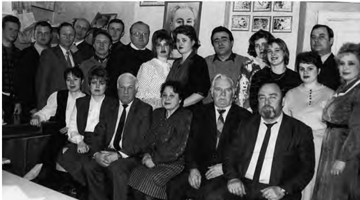
Науково-педагогічний склад кафедри (1997 рік)