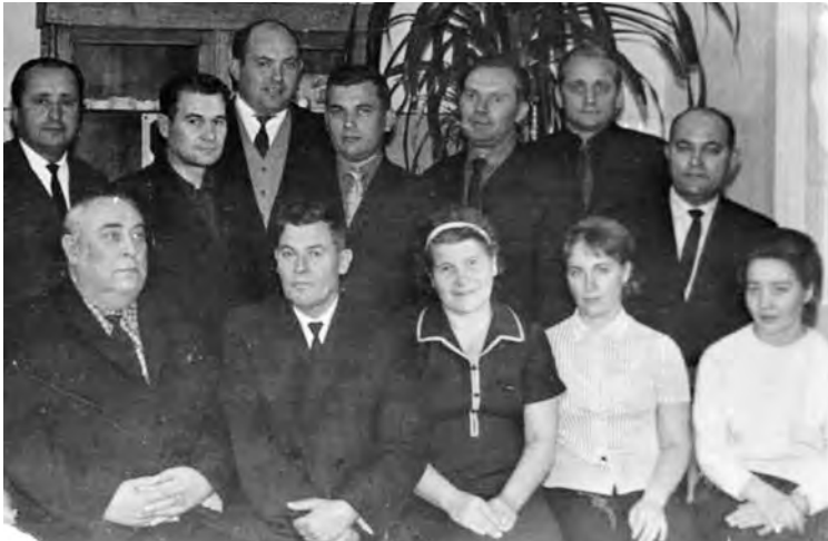
Науково-педагогічний склад кафедри (1967 рік)