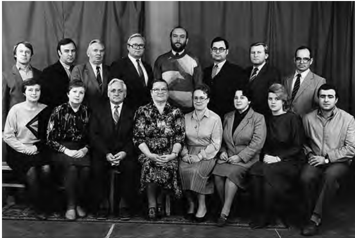
Науково-педагогічний склад кафедри (1988 рік)