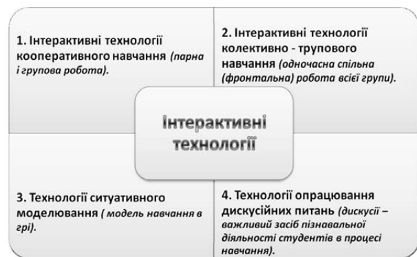
Рис. 2. Групи інтерактивних технологій.

Завдяки працям багатьох дослідників, визначення здібностей та відмінностей у процесі навчання є на сьогодні популярним явищем. Деякі дослідники пропонують виокремити візуальний, аудиторний та кінетичний типи навчання. Дуже важливо враховувати особливості сприйняття інформації, яким надають перевагу студенти. Люди навчаються по-різному: дехто краще засвоює матеріал, коли читає його, дехто – коли слухає, а дехто – в процесі практичних знань. Викладач, який подає матеріал в різний спосіб (урізноманітнює форми й методи навчання), має більші можливості забезпечити потреби аудиторії й закріпити вивчене. Таким чином задовольняється потреба і у візуальному, і у вербальному сприйнятті інформації. Створюючи на заняттях ситуації саморозкриття та успіху, надається можливість студентам проявити