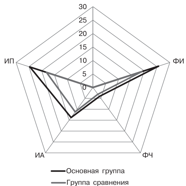
Рис. 1. Показатели ФАМ у больных ХБ (обострение) в сочетании с ПЯ ДПК после лечения.

Так, в основной группе больных отмечалось увеличение ФИ в 1,52 раза ( P < 0,001 ) – до 25,6 \pm 1,1\% (в группе сравнения – до 19,1 \pm 1,1\% , т. е. только в 1,12; P > 0,05 ). Показатель ФЧ (на 14-16 день от начала лечения) у больных основной группы увеличился и 1,46 раза ( 4,1 \pm 0,25 ; P < 0,01 ) и не отличался от референтной нормы ( P > 0,05 ) в то время, как в группе сравнения динамика этого показателя не была достоверной ( 3,1 \pm 0,16 ). Достоверно позитивная динамика в значениях показателя ИА