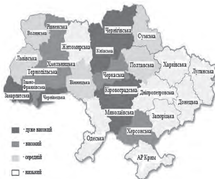
Рис. 1. Захворюваність на лептоспіроз в Україні серед людей (1998-2013 рр.) (на 100 тисяч населення).

Найвищою впродовж останніх двох десятиріч захворюваність на лептоспіроз була в Закарпатській, Київській, Кіровоградській, Миколаївській, Чернівецькій та Чернівецькій областях з максимальними показниками 12,77 та 12,65 на 100 тис. населення у 1997 р. в Кіровоградській та Закарпатській областях відповідно (рис. 1). Низьким рівнем характеризуєть-