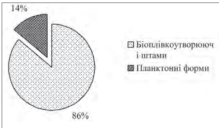
Рис. 2. Відсоткове співвідношення біоплівкоутворюючих та планктонних штамів.