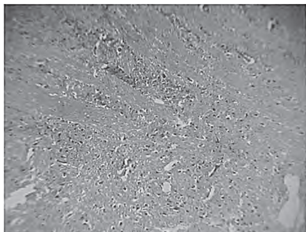
Рис. 2. Морфологічне дослідження (мікропрепарат). Різна інтенсивність набряку й ішемії в стовбурі головного мозку. Фарбування гематоксилін Ерліха-еозином. Збільшення х8, х7 і х40, х7.

болюс, потім 5,4 мг/кг – 48 годин). Після 8 годин з моменту травми метилпреднизолон не застосовували. З огляду на конкретні строки введення метилпреднизолону, обмеження використання при поєднаній травми й факторах ризику тромбоемболії, розвиток ускладнень, внаслідок інфузії препарату, не відзначався [15].