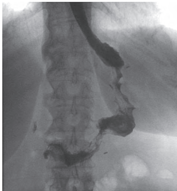
Рис. 3. Рентгенологічна картина загоєння неспроможності лінії стаплерного шва в шлунковій трубці.

Лікування неспроможності після рукавної резекції шлунка передбачає ранню діагностику їх ознак і симптомів. Традиційні варіанти хірургічного втручання можуть бути пов'язані з збільшенням тривалості лікування, захворюваності та летальності. У цьому контексті ендоскопія спрямована на лікування цих ускладнень з менш інвазивним характером та зменшенням захворюваності.