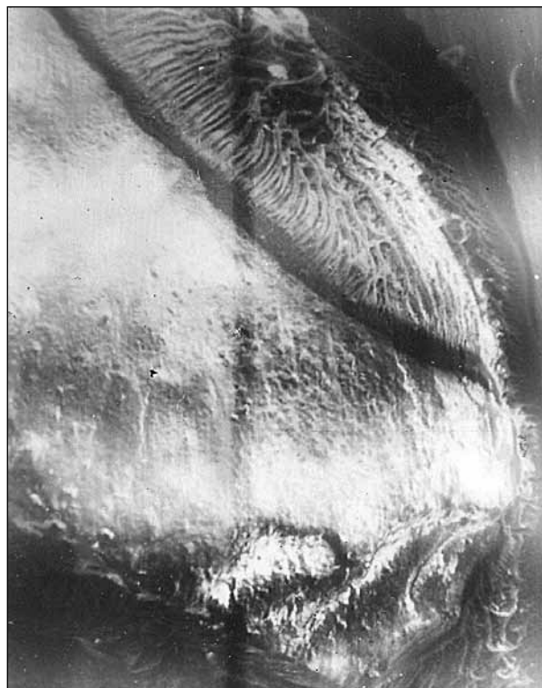
Рис. 4. Фрагмент назубного налета на эмали зуба человека. СЭМ, x800. Наблюдение А.П. Костыренко.

В частности, это функциональная специализация представителей микрофлоры в биотопе, механизм ее приобретения и изменения.