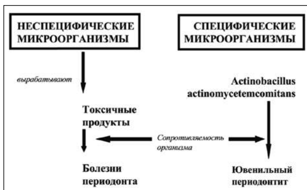
Рис. 1. Зубной налет в этиологии заболеваний пародонта.

Существуют ряд работ конца 90-х гг. XX века и первого десятилетия XXI века, в которых отмечен параллелизм кариозного процесса и заболеваний пародонта [13,14,15,16].