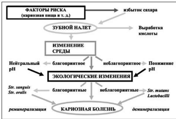
Рис. 5. Гипотетическая экологическая ситуация в зубном налете (адаптировано П.А. Леус по P.D. March).

Проблема в классификации пародонтопатогенов согласно этиологии воспалительного процесса в пародонте. Подобная работа отсутствует в кариесологии, где инициация кариозного процесса на различных участках зуба также осуществляется различными микроорганизмами.