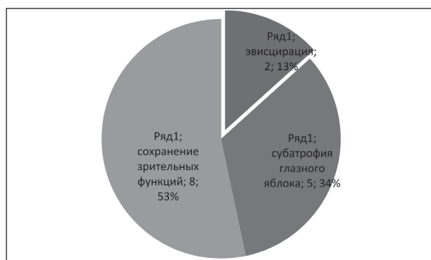
Рис. 2. Результаты лечения посттравматических эндофтальмитов.

Результаты проведенного лечения были изучены в ходе данного исследования и представлены на диаграмме (рис. 2).