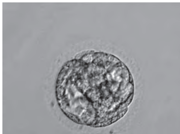
Рис. 3. Бластици з порушеннями морфологічних параметрів. Збільшення x250.

трації сперматозоїдів в еякуляті на морфологію ембріонів, отриманих від чоловіків зі зниженими параметрами репродуктивної функції, у даному дослідженні не доведено.