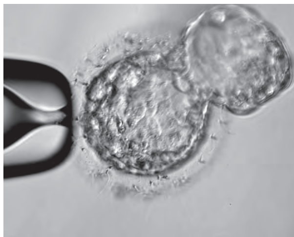
Рис. 1. Бластоциста 5АА за класифікацією D. K. Gardner in vitro перед процедурою біопсії. Збільшення x250.

Результати дослідження та їх обговорення. У результаті молекулярно-генетичного тестування у чоловіків зі зниженими параметрами спермограми не