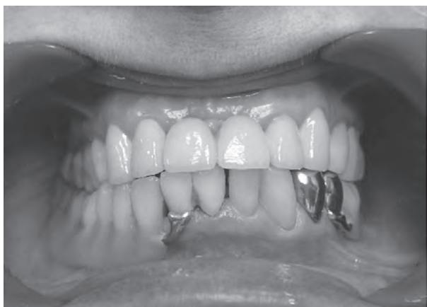
Рис. 1. Пацієнт, 52 рр., ревматоїдний артрит. Зубні ряди в положенні центральної оклюзії. На нижній щелепі зафіксовано частковий знімний пластинковий протез з литими кламерами.

іклі і на кожному горбку премоляра повинна була відбиватися одна контактна точка і 3-4 точки – на горбках молярів.