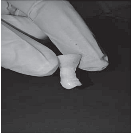
Рисунок 2 – Зуб зафіксовано вертикально у самотвердіючій пластмасі.

2 – проникнення барвника до емалево-дентинного з'єднання;