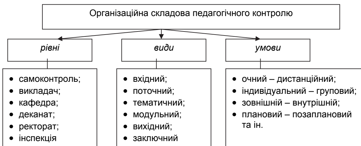
Рис. 2. Структура організаційної складової теорії педагогічного контролю

Оснoву організаційної складової теорії педагогічного контролю складають: рівні, види, умови тощо (рис. 2).