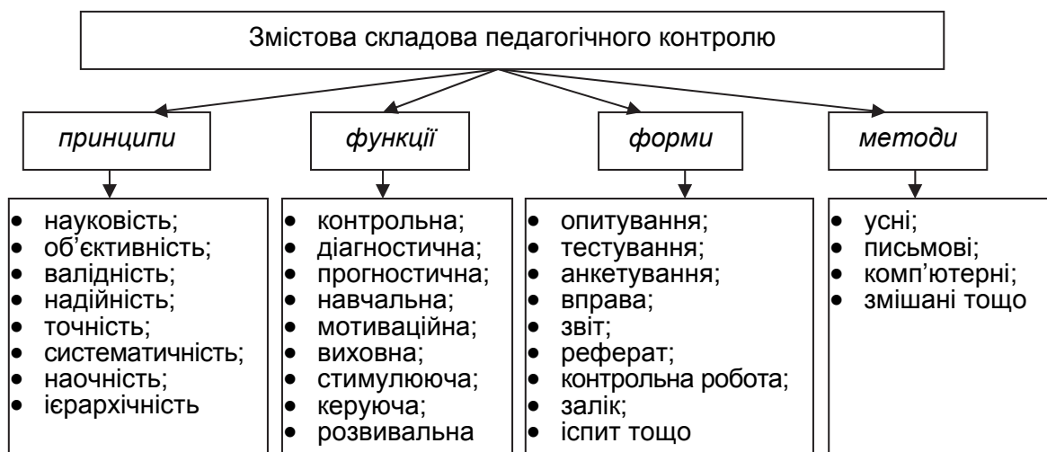
Рис. 1. Структура змісту теорії педагогічного контролю

Основу змістової складової теорії педагогічного контролю складають принципи, функції, форми та методи (рис. 1).