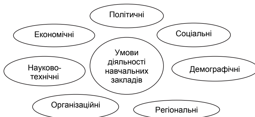
Рис. 1. Зовнішні фактори, що впливають на діяльність навчальних закладів

В умовах становлення в Україні громадянського суспільства, система ППО має стати найважливішим чинником гуманізації суспільно-економічних відносин, формування нових життєвих орієнтирів особистості. Швидкі темпи появи економічних інновацій, зростання наднаціональних організацій, що визначають політику держави й окремих соціальних груп, структур, які діють у рамках, що ширше, ніж рамки окремих націй — все це характеризує глобалізаційні процеси. Економічний вимір соціальних процесів часто використовується як ключовий чинник глобалізації. Нині в економіці знань існує орієнтація на людські ресурси, що є ключовою формою інтелектуального капіталу. В системі освіти економіка знань характеризується глобальним ринком з попитом на кваліфіковану робочу силу, яка визнається документом на відповідність кваліфікації [3].