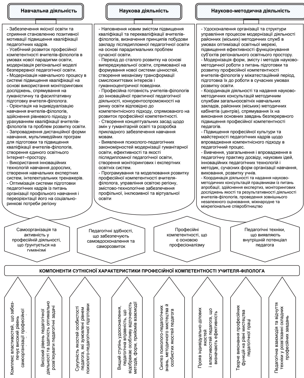
Рис. 2. Зміст процесу розвитку професійної компетентності вчителя-філолога

Важливу роль відіграє також модернізація навчального процесу в системі підвищення кваліфікації на основі використання моніторингових досліджень, спрямування на гуманістичну та фасилітативну підготовку вчителя-філолога; орієнтація на індивідуалізацію навчання вчителів-філологів, здійснення рівневого підходу з урахуванням рівня кваліфікації фахівців та проблем розвитку освіти.