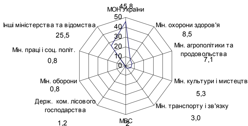
Рис. 3. Структура ВНЗ за відомчою приналежністю, %, 2012 р.

Проаналізувавши стан управління освітньою сферою на прикладі вищих навчальних закладів, можна сказати, що управління ними – це взаємодія і співробітництво між усіма структурами підрозділів вищої школи, викладачами, студентами та слухачами. Регулювання, як елемент управління, має стосуватись і структури вищих навчальних закладів. Адже від цього залежить й ефективність економіки. Освіта, як відомо, невід'ємна складова більшості економічних і соціальних процесів, які відбуваються в суспільстві. Якісна освіта забезпечує ефективну підготовку кадрів для національного господарства. А це передбачає формування оптимальної структури мережі вищих навчальних закладів. Нині за відомчою приналежністю вона є такою: