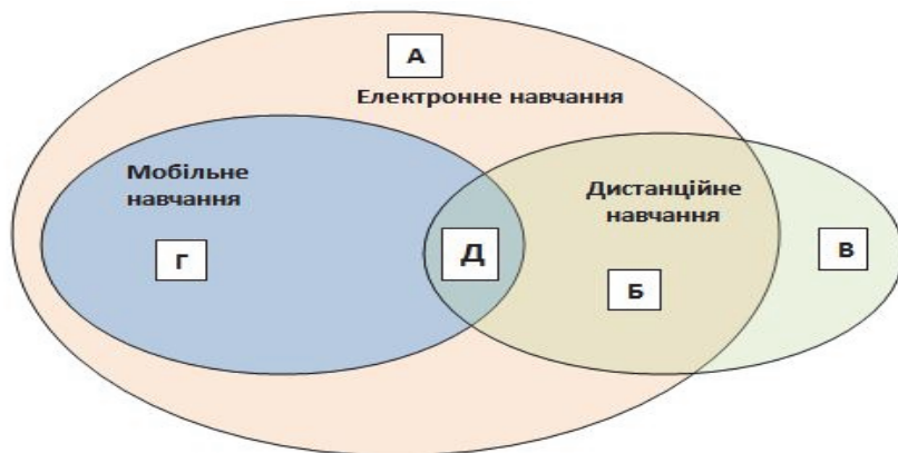
Рис. 2. Співвідношення електронного, дистанційного та мобільного навчання

Мобільне ж навчання співвідноситься з поняттями дистанційне навчання та електронне навчання наступним чином. Якщо останні два поняття розуміти як окремі, то мобільне навчання має спільні риси з електронним навчанням у питаннях використання «мобільних пристроїв» та бездротових мереж, тому що в «класичному» електронному навчанні ще використовується ПК та провідні мережі, а з дистанційним навчанням поєднується тим, що воно здійснюється у будь-який час, будь-де, причому у навчальному процесі обов'язково має місце взаємодія викладача та слухача. Якщо ці поняття ототожнювати, то мобільне навчання буде одним з підвидів дистанційного навчання або e-learning. У цьому сенсі можна говорити про мобільне електронне навчання, як навчання в класі за допомогою мобільних пристроїв та бездротових мереж і мобільне дистанційне навчання, коли навчальний процес йде за межами навчального закладу, взаємодія відбувається синхронно й асинхронно (онлайн, оффлайн). Ці твердження можна зобразити схематично: