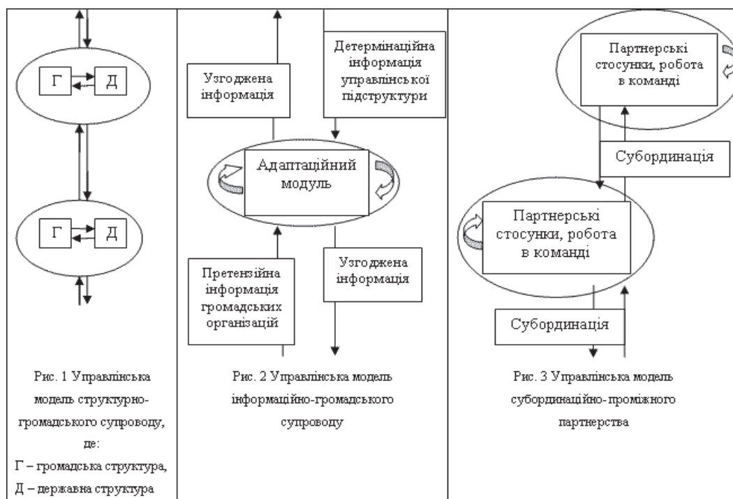
Рис. 3. Моделі громадсько спрямованого управління

часткової мети створена команда розпускається і вертикаль поновлюється. Основне призначення моделі – створення механізму субординаційно-партнерських стосунків з метою забезпечення взаємної адаптації та досягнення загальних переваг (рис. 3).