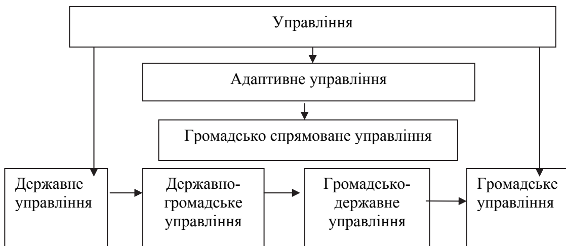
Рис. 1. Структура та генезис громадсько спрямованого управління

• З позиції теорії управління громадсько спрямоване управління розглядається нами як інтеграція державного й громадського управління, тому його структуру та генезис можна представити у такому вигляді (рис. 1).