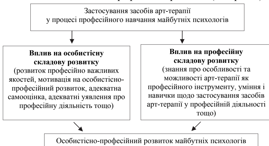
Рис. 1. Вплив засобів арт-терапії на особистісно-професійний розвиток майбутніх психологів

Аналіз практики застосування засобів арт-терапії для особистісно-професійного розвитку майбутніх фахівців дає нам можливість стверджувати, що застосування арт-терапії у процесі підготовки фахівців-психологів здійснює комплексний вплив на їх особистісно-професійний розвиток (див. рис. 1):